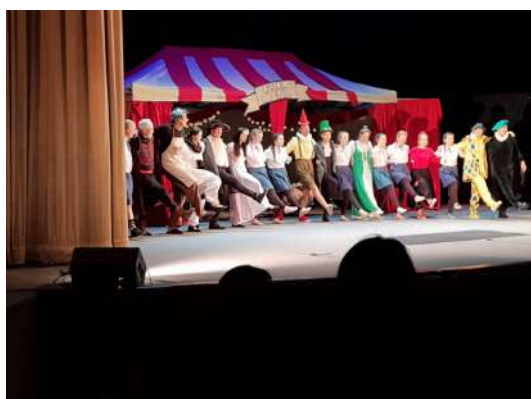
divadelní herci pri tanci

Dňa 14.2.2023 sa niektoré triedy z našej školy zúčastnili divadelného predstavenia Pinocchio v ODA. Žiaci odchádzali so silným kultúrnym zážitkom.