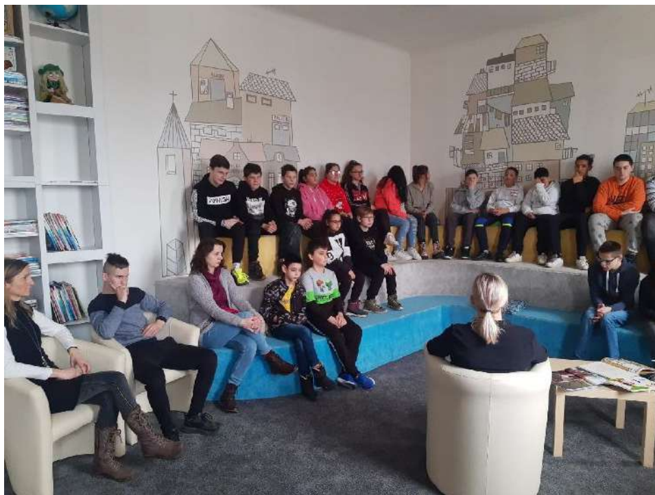
panie asistentky, žiaci 5.A, 6.A a 7.A a pani knihovnička

V rámci aktivít „Marec - mesiac knihy“ sme navštívili detské oddelenie knižnice na Hasičskej ulici v Trenčíne. Žiaci 1. stupňa si vypočuli rozprávku "O troch grošoch " z knihy Moje najmilšie rozprávky od Pavla Dobšinského. Pani knihovnička pútavo vyrozprávala dej tejto známej a poučnej rozprávky. V peknom a podnetnom prostredí knižnice sme sa potom zahrali na ilustrátorov a každý si vytvoril k tejto rozprávke svoju vlastnú knižku s originálnymi obrázkami.