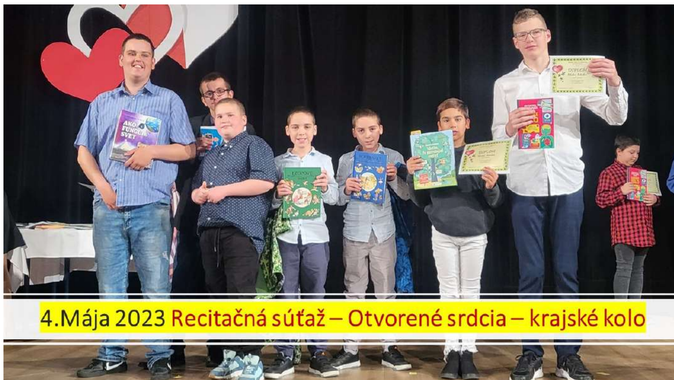
4.Mája 2023 Recitačná súťaž – Otvorené srdcia – krajské kolo

Všetci ocenení si domov odniesli diplom a krásnu knihu. Za úspešnú reprezentáciu školy patrí žiakom POĎAKOVANIE!