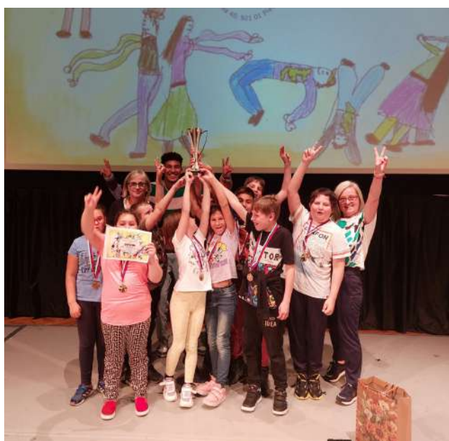
Radosť z výhry bola veľká.