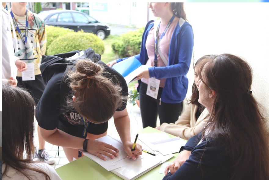
Punkt kontrolny II — dopasowanie starych zdjęć Ropczyc do współczesnych oraz odpowiednich podpisów