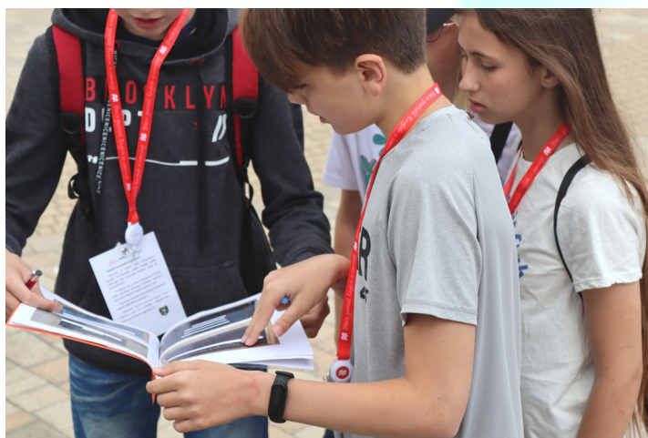
Wypełnianie karty drużyny— rozwiązywanie zadań w oparciu o podane wskazówki