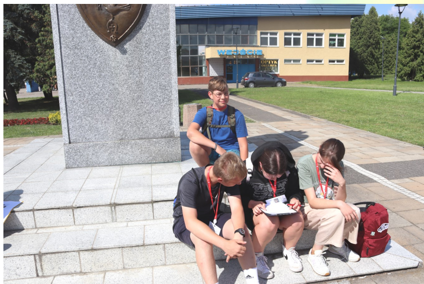
Punkt kontrolny I — test wiedzy dotyczący historii miasta