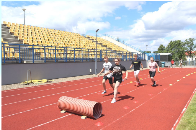
Punkt kontrolny V — rozgrywki sportowe