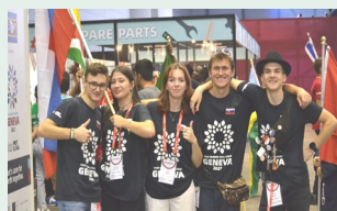
FIRST GLOBAL Ženeva