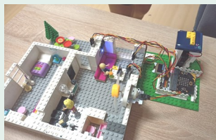
Učíme s hardvérom