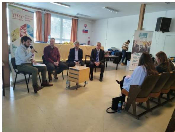
Diskusie s prizvanými odborníkmi z praxe