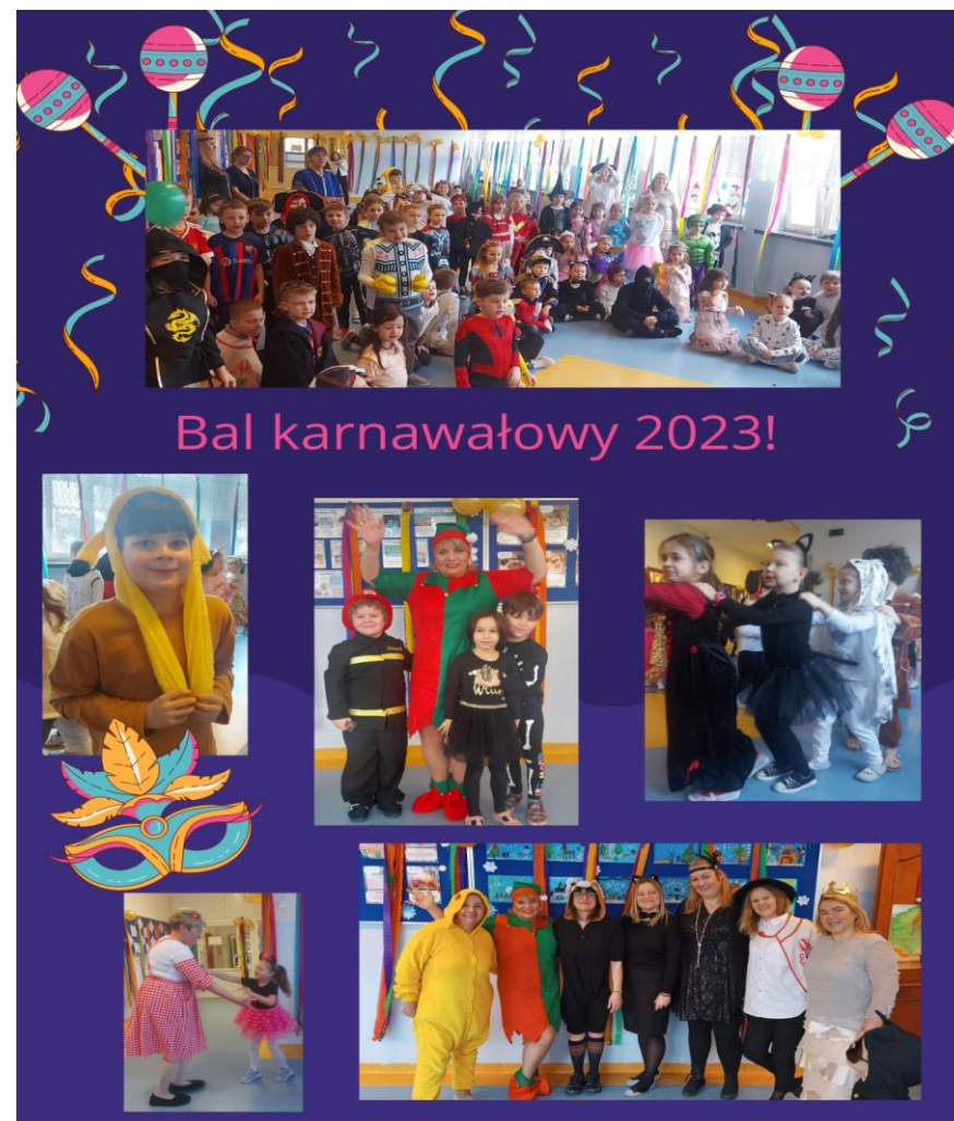
Uczniowie klasy 3a