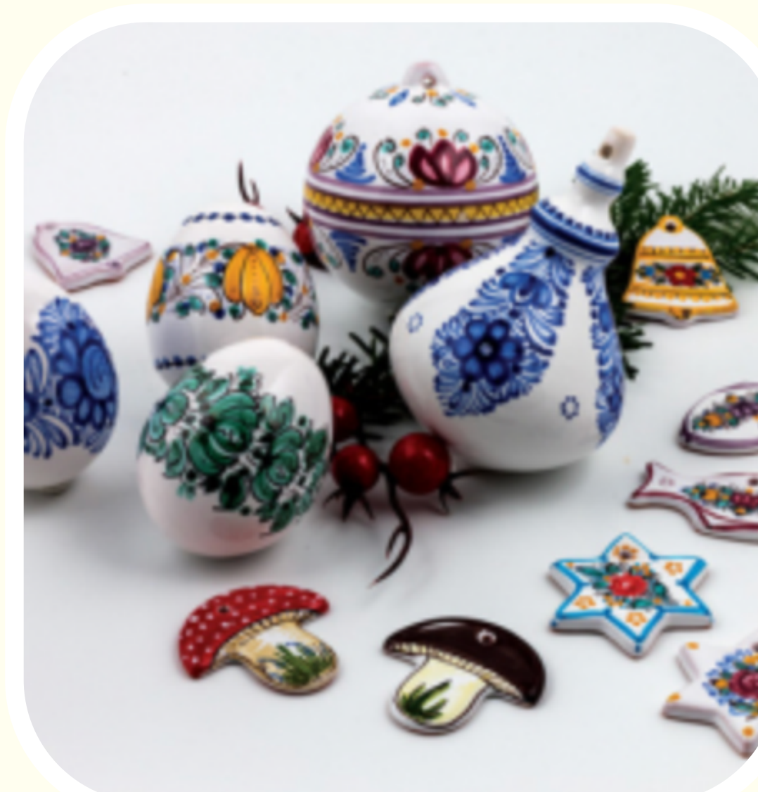
SLOVENSKÁ ĽUDOVÁ MAJOLIKA MODRA

Škola ľudových tancov pre deti (prezentácia tanečného krúžku) o 15:30 Telocvičňa MŠ