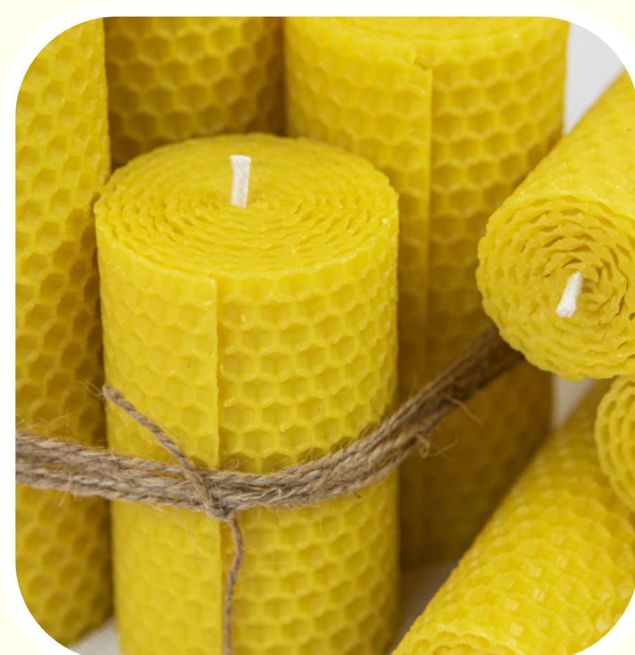
VÝROBA SVIEČOK PÁNA POLIAKA