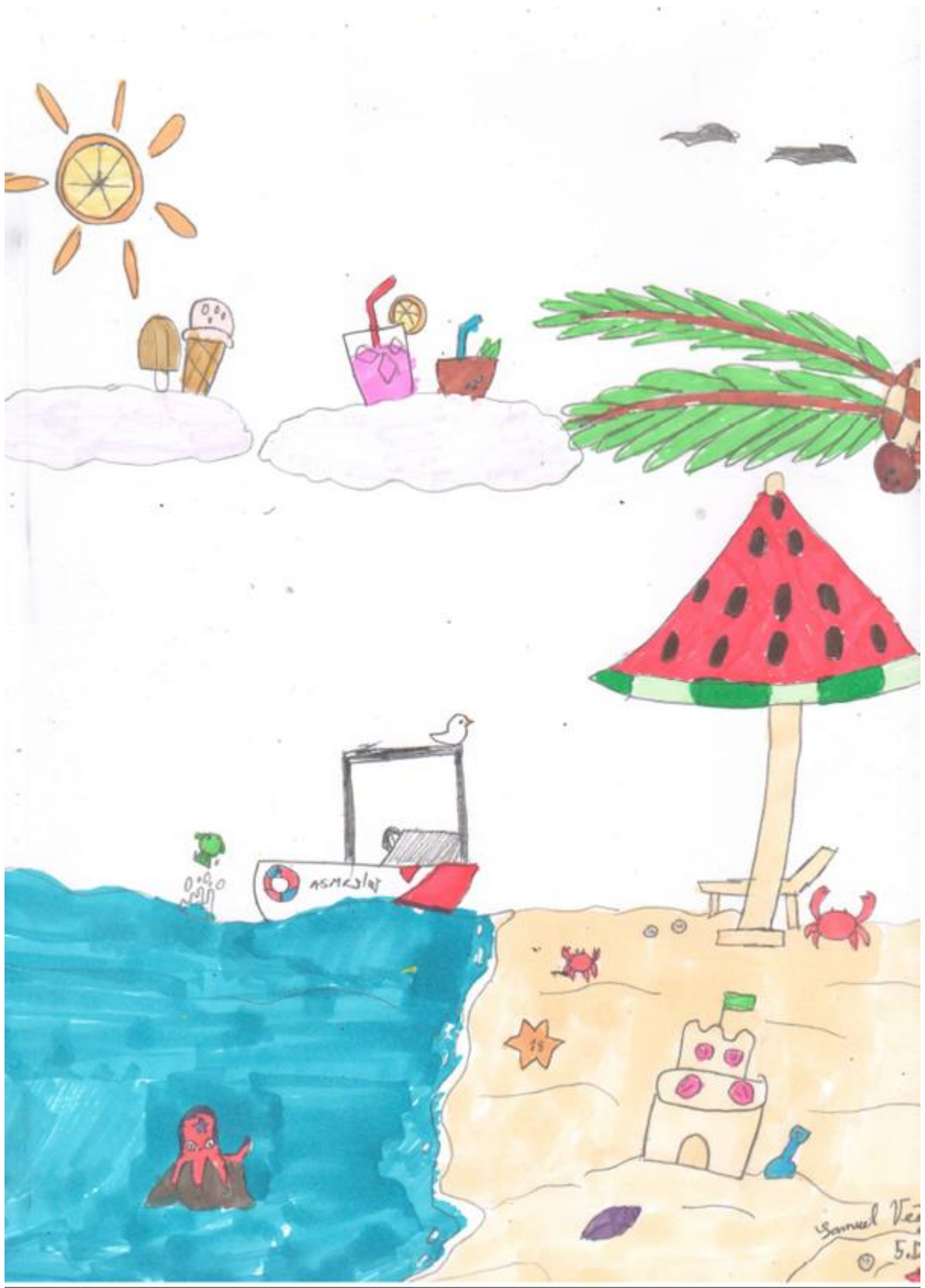
Ilustrácia: Samuel Vég, 5.D