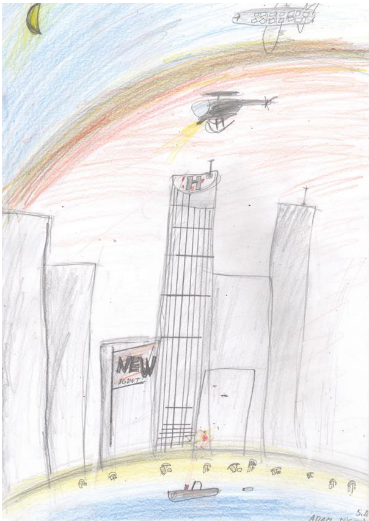
Ilustrácia: Adam Dugovič, 5.D