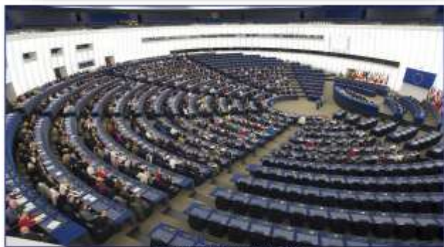
EUROPELA DU 18 DÉCEMBRE 2017 PARLEMENT EUROPÉEN À STRASBOURG