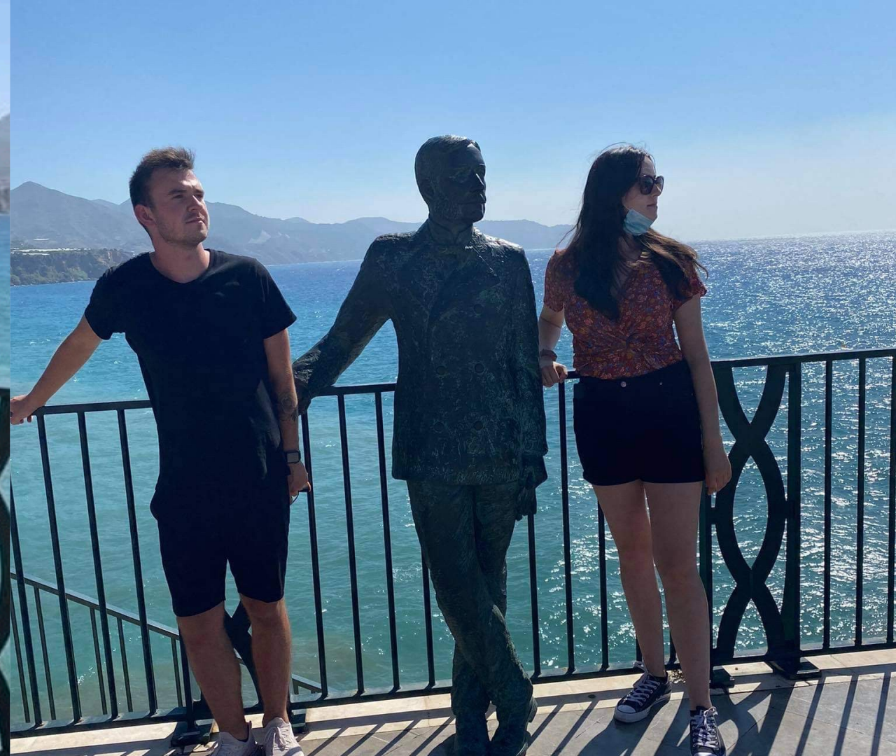
Alfons XII Burbon