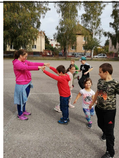
deti z škôd na školskom ihrisku

Aj deti v školskom klube nezaháľajú a využívajú teplé jesenné počasie na šport a zábavu. Rozhýbali sa nielen pri futbalových, basketbalových a tenisových prihrávkach, ale aj pri naháňačke a zlatej bráne. V triedach tiež vytvorili rôzne jesenné obrázky stromov a listov.