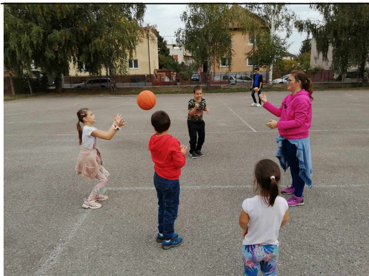
deti z škôd na školskom ihrisku