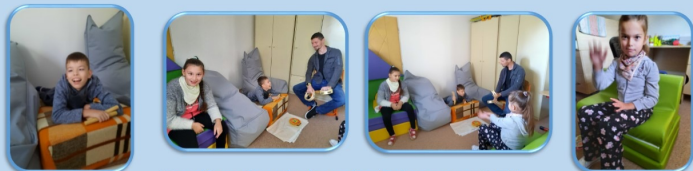
Hodina hudobnej výchovy v PT1