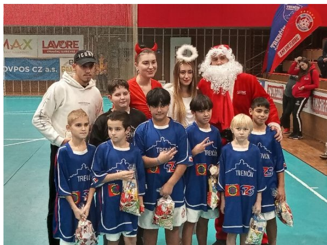
naši žiaci s Mikulášom

Ďakujeme klubu AS Trenčín za pozvanie na turnaj a našim chlapcom za vzornú a obetavú reprezentáciu školy. Taktiež ďakujeme aj všetkým učiteľom a žiakom, ktorí nás prišli povzbudiť a tešili sa z našej hry a radostnej i búrlivej atmosféry, ktorá na turnaji vládla.