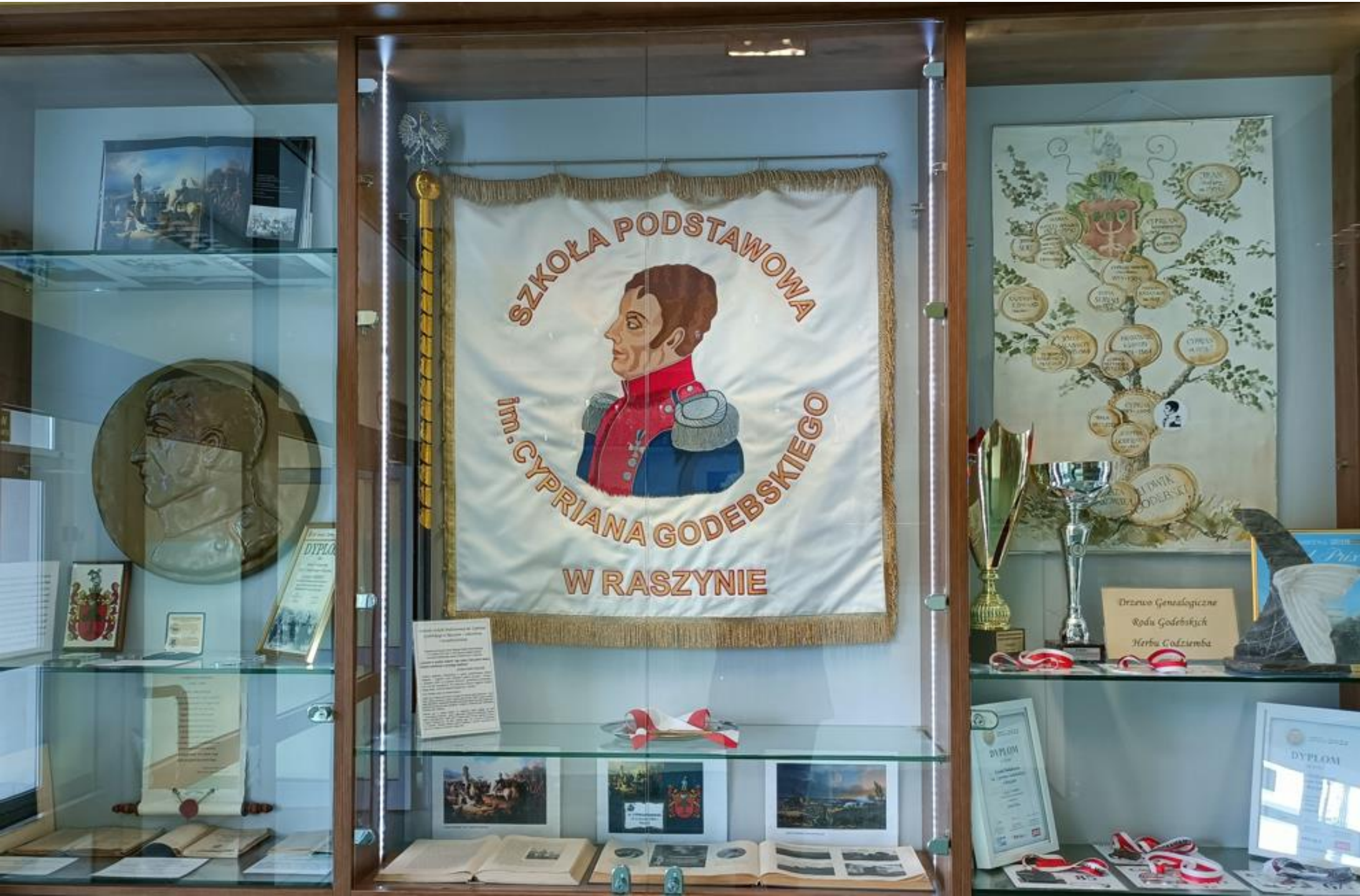
Gablota w szkole na parterze