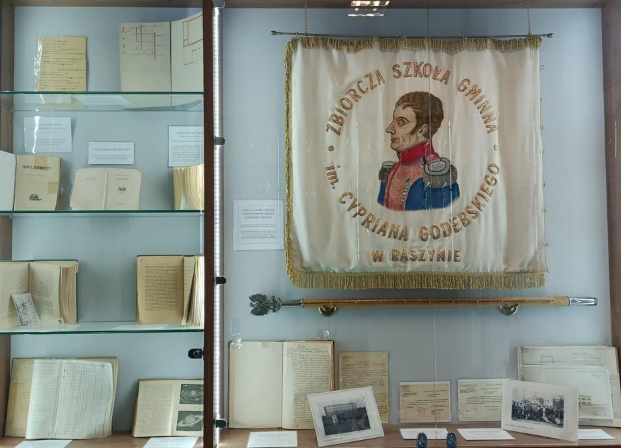
Gablota z archiwalnymi dokumentami