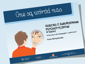
DZIECKO Z ZABURZENIAMI PSYCHOTYCZNYMI W SZKOLE