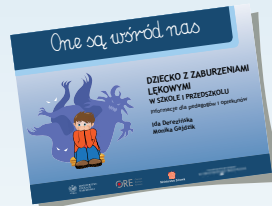
DZIECKO Z ZABURZENIAMI LĘKOWYMI W SZKOLE I PRZEDSZKOLU