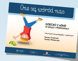
DZIECKO Z ADHD W SZKOLE I PRZEDSZKOLU