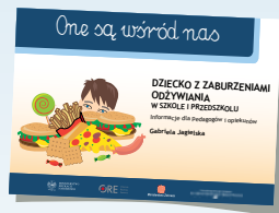
DZIECKO Z ZABURZENIAMI ODŻYWIANIA W SZKOLE I PRZEDSZKOLU