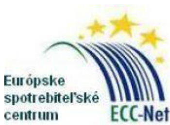
Obr. 2.3 Logo Európskeho spotrebiteľského centra

Európske poradenské centrum spotrebiteľom nedokáže pomôcť pri riešení reklamácií v rámci Slovenska, či tretích krajín