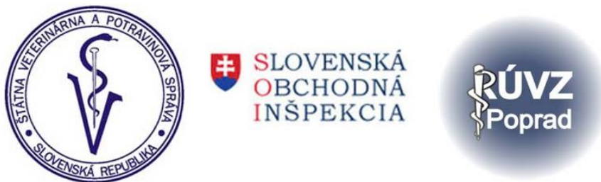
Obr. 2.1 Logá orgánov štátneho dozoru

Medzi ďalšie orgány štátneho dozoru patria i