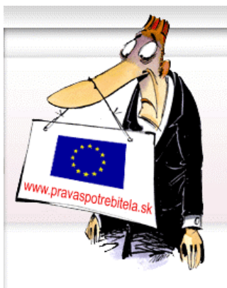
Obr. 2.5 Práva spotrebiteľa

Vedeli ste, že ak odstúpite od zmluvy, nedostanete za to žiadnu pokutu od predávajúceho, respektíve nezaplatíte žiadne poplatky navyše? Ide totiž o vaše právo.