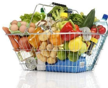
Obr. 1.1 : Nákupný košík spotrebiteľa