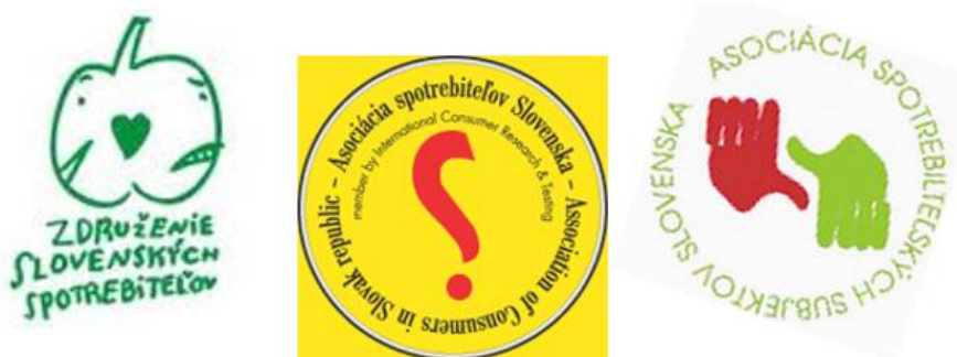
Obr. 2.2 Logá spotrebiteľských združení